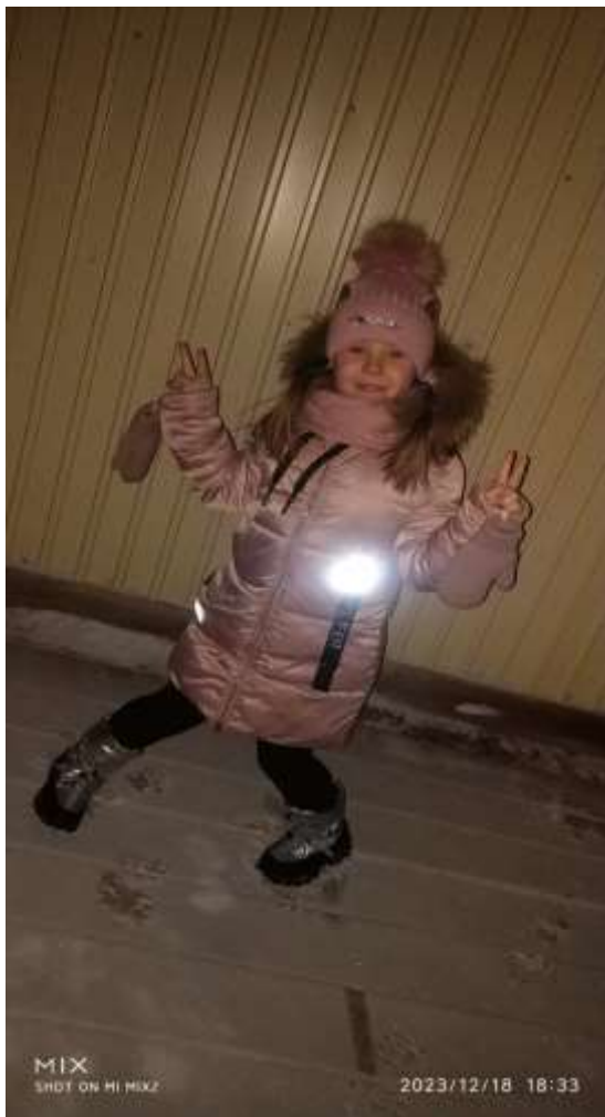
Фото-конкурс «Стань заметней на дороге»