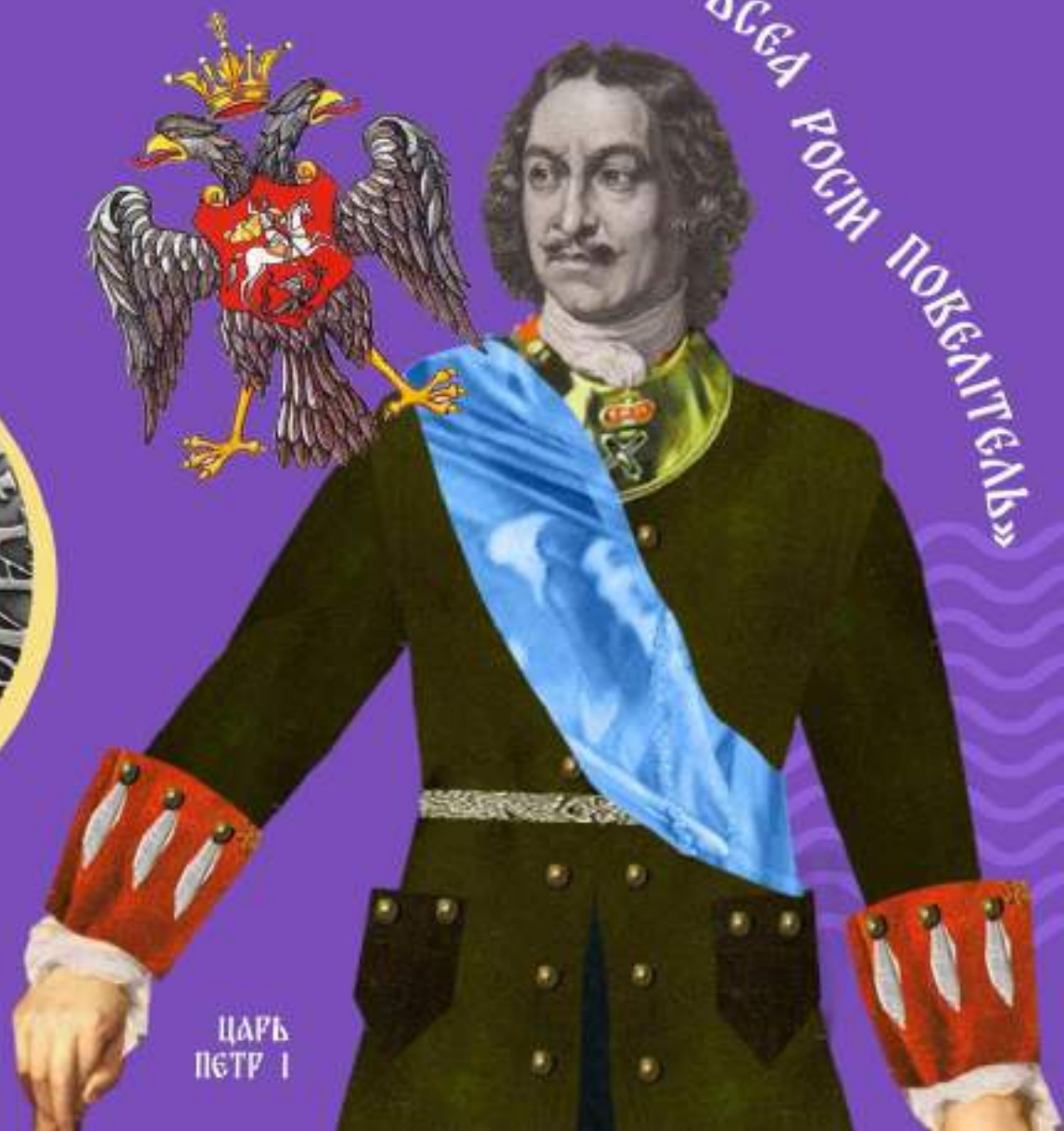
ЦАРЬ ПЕТРЪ I

«ЦРЬ ПЕТРЪ АЛЕКСІЕВИЧЪ ВСЕА РОССІИ ПОВЕЛИТЕЛЬ»