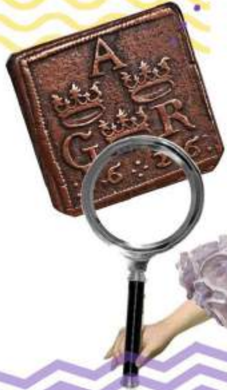
ИМПЕРАТРИЦА ЕКАТЕРИНА I